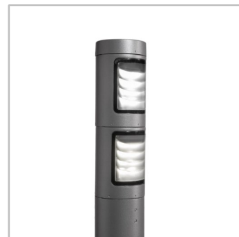
Grilajele de protecție previn poluarea luminoasă și aduc confort vizual.