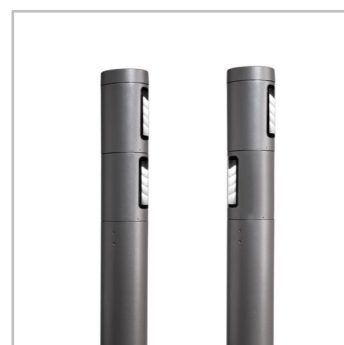
Modulele de iluminat pot fi poziționate în aceeași direcție sau în direcții opuse, pentru a emite lumină până la 180°.