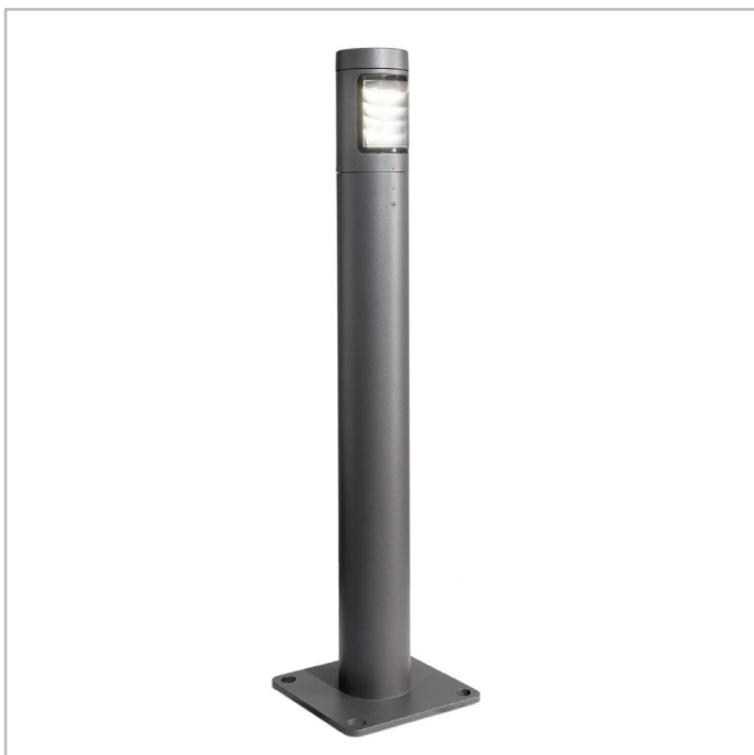
BORA EXPLORA GEN2 | Un modul de iluminat