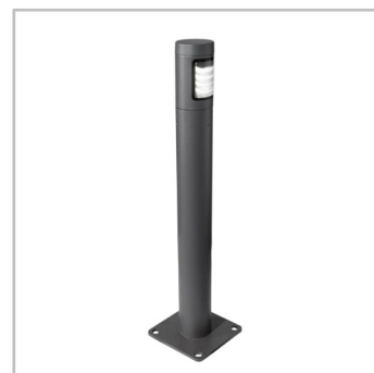
BORA EXPLORA GEN2 are un design modern care se integrează în orice peisaj urban.