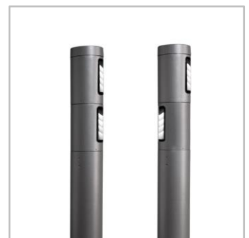
A világítómodulok forgathatók azonos vagy egymással ellentétes irányba, így akár 180°-os világítás is megoldható.