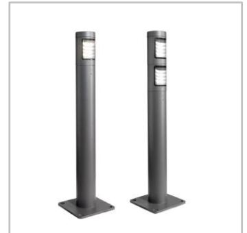
A BORA EXPLORA GEN2 elérhető egy vagy két világítómodullal.

Diszkrét, modern kialakításával a BORA EXPLORA GEN2 ötvözi az esztétikát a funkcionalitással, és biztonságos, kellemes légkört teremt a városi tereken.