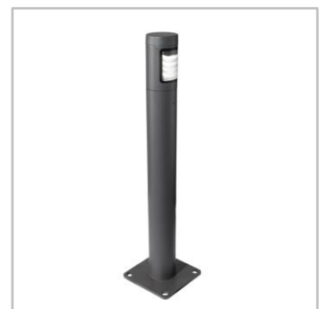
A BORA EXPLORA GEN2 modern kialakításával beleolvad bármilyen városi környezetbe.