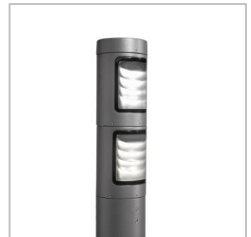
A lamellákkal elkerülhető a fényszennyezés, és biztosítható a vizuális kényelem.