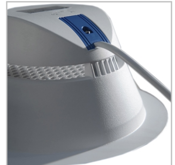
Il design offre una dissipazione del calore ottimale per prestazioni di lunga durata.

INDU DOWNLIGHT offre anche un elevato comfort visivo. Fornisce una luce bianca neutra con un elevato indice di resa cromatica (CRI 80).