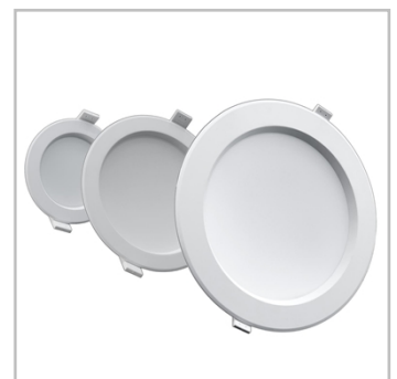
INDU DOWNLIGHT è disponibile in 3 taglie, ognuna delle quali offre un flusso luminoso tipico.