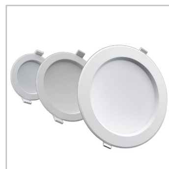
INDU DOWNLIGHT est disponible en 3 tailles, chacune offrant un flux lumineux typique.