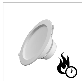
Résistant au feu, INDU DOWNLIGHT est conforme aux réglementations de sécurité intérieure les plus strictes.