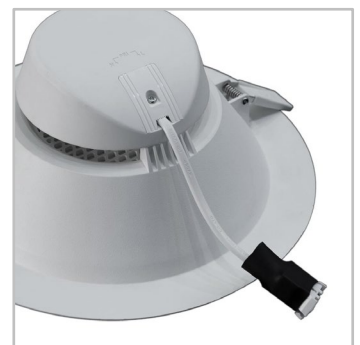
La conexión eléctrica rápida se realiza en la parte posterior de la luminaria.