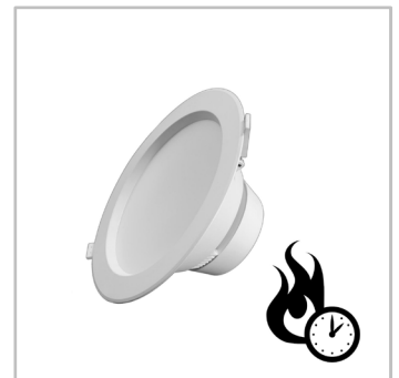
INDU DOWNLIGHT resistente al fuego cumple con las normativas más estrictas de seguridad en interiores.