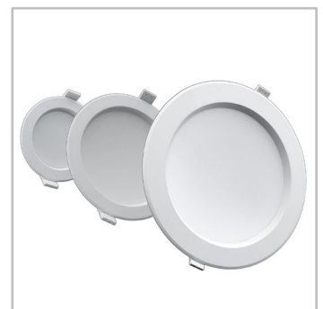
INDU DOWNLIGHT está disponible en 3 tamaños, cada uno con una emisión luminosa típica.